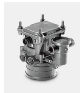
Oryginalne zawory hamulcowe MAN