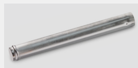
Oryginalne zbiorniki płynu MAN

Systemy klimatyzacji odgrywają ważną rolę w zapewnianiu komfortu i dobrego samopoczucia. Dodatkowo zapobiegają parowaniu szyb w chłodne dni, zapewniając tym samym dobrą widoczność. W upalne dni pomagają kierowcom zachować optymalną temperaturę i koncentrację.