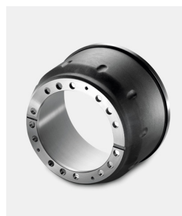
Oryginalne bębny hamulcowe MAN