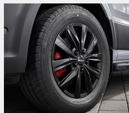
Oryginalna felga MAN TGE, czarny połysk

Dostosuj swój pojazd za pomocą oryginalnych akcesoriów MAN i zwiększ swoje bezpieczeństwo oraz komfort.