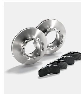
Oryginalne tarcze hamulcowe i okładziny MAN

W krytycznych sytuacjach drogowych musisz bezwarunkowo polegać na swoich hamulcach. To one są decydującym czynnikiem wpływającym na bezpieczeństwo Twoje, pasażerów, ładunku oraz innych uczestników ruchu drogowego.