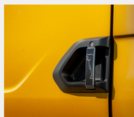
Zestaw oryginalnych nakładek na klamki drzwi MAN z motywem lwa