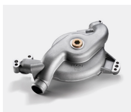
Oryginalne pompy cieczy chłodzącej MAN