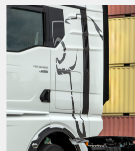
Oryginalna folia dekoracyjna MAN „Lion Outline”

Kotpaki, pierścienie osłonowe, nakładki ochronne na nakrętki koła z motywem lwa