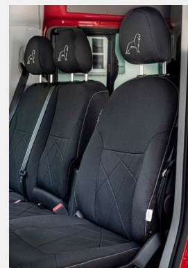
Oryginalne pokrowce na siedzenia MAN TGE