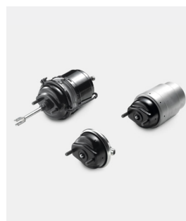
Oryginalne cylindry hamulcowe MAN