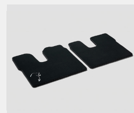
Oryginalne welurowe dywaniki MAN