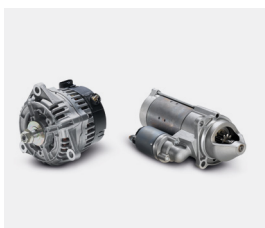
Regenerowane alternatory i rozruszniki MAN ecoline