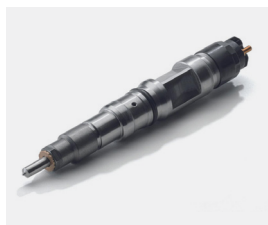
Oryginalny wtryskiwacz common rail MAN