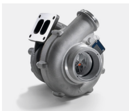
Regenerowane turbosprężarki MAN ecoline

Składający się z napinacza paska i pasków klinowych – zestaw zapewnia oszczędność kosztów