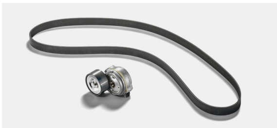
Oryginalne paski MAN

Głównym zadaniem pasków jest napędzanie urządzeń pomocniczych. Podczas pracy są one narażone na ekstremalne obciążenia. Wybierz oryginalne paski MAN, ponieważ zapewniają długi okres eksploatacji i wysoką efektywność.