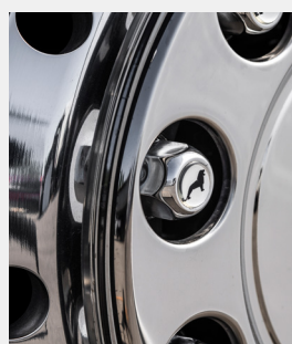
Oryginalne wyposażenie kół ze stali nierdzewnej

Kotpaki, pierścienie osłonowe, nakładki ochronne na nakrętki koła z motywem lwa